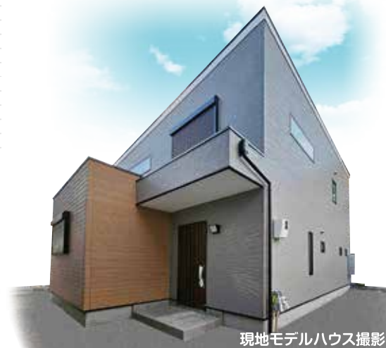
現地モデルハウス撮影